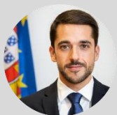
João Torres, Secretário de Estado do Comércio, Serviços e Defesa do Consumidor, Ministério da Economia e Transição Digital