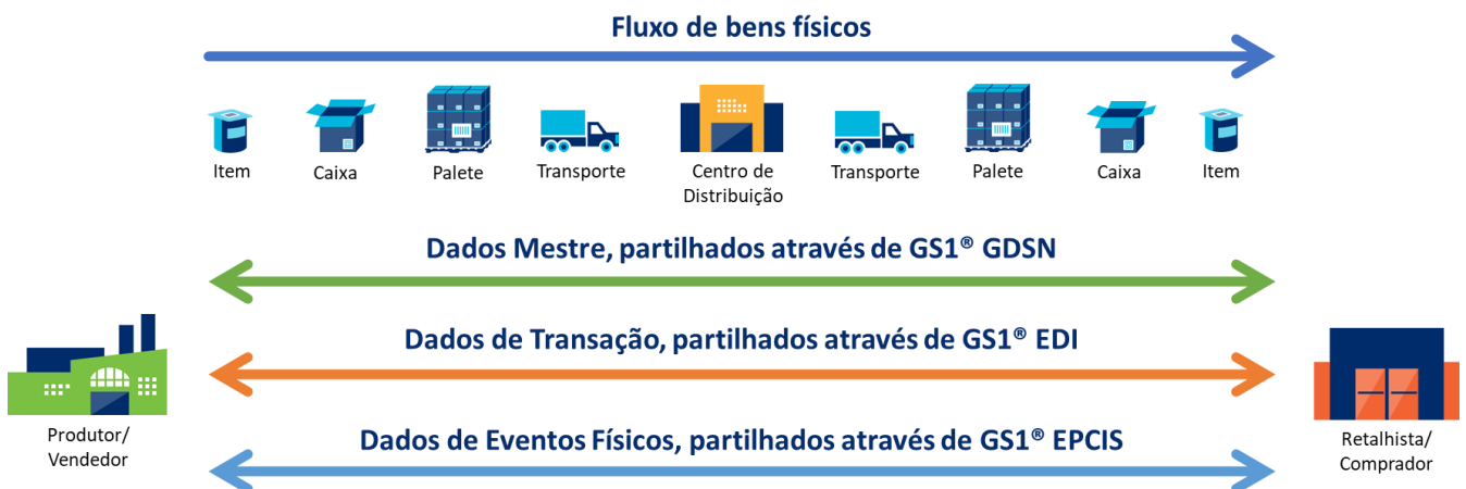
Figura 1. Standards GS1 para a troca automatizada de dados de negócio

A GS1 fornece Standards para apoiar a troca e partilha automatizada de diferentes tipos de dados, como descrito na figura abaixo.