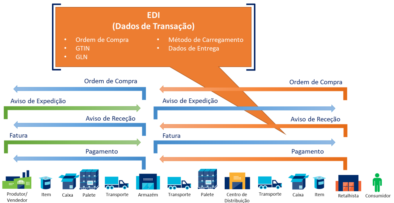
Figura 3. Dados de Transação através de GS1® EDI

O gráfico seguinte ilustra o modo como a GS1 eCom pode ser utilizada para a troca de dados de transação entre fabricantes, logística, fornecedores, distribuidores e retalhistas.