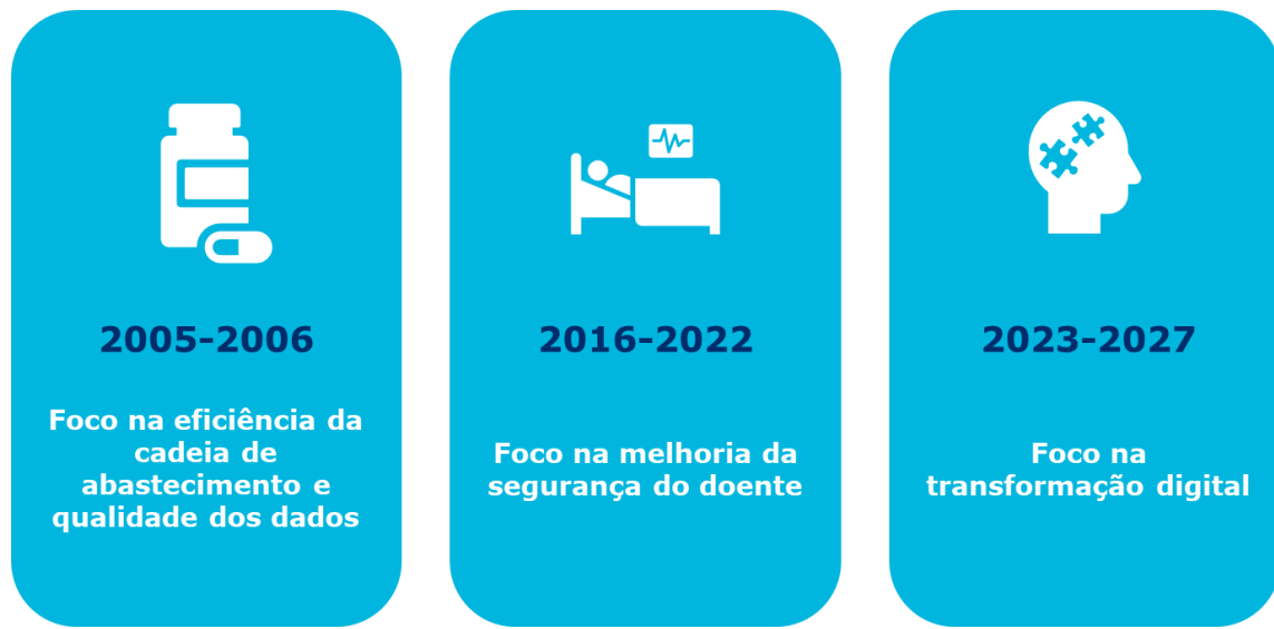
Imagem 2 – Ação da GS1 Healthcare ao longo dos anos.