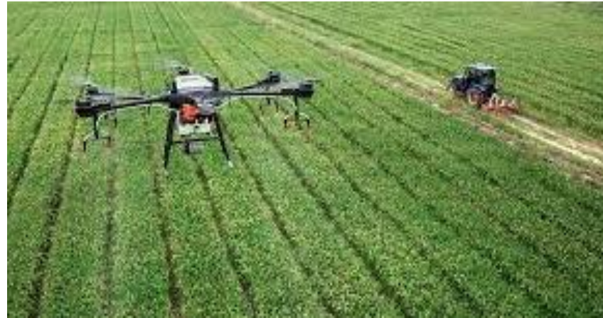
Com grande evolução tecnológica