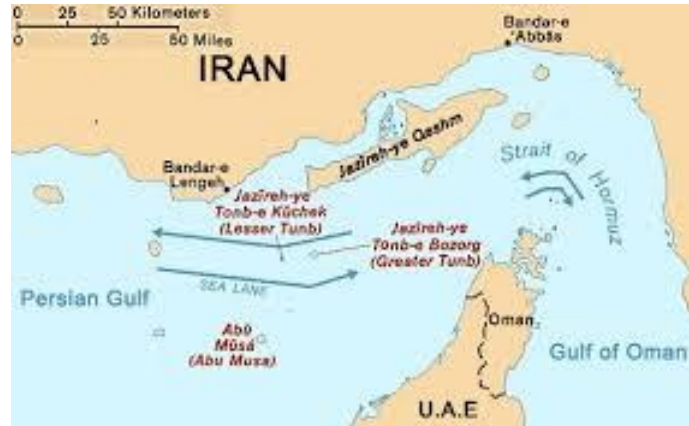
Aumento dos custos de produção II (Guerra do Irão)