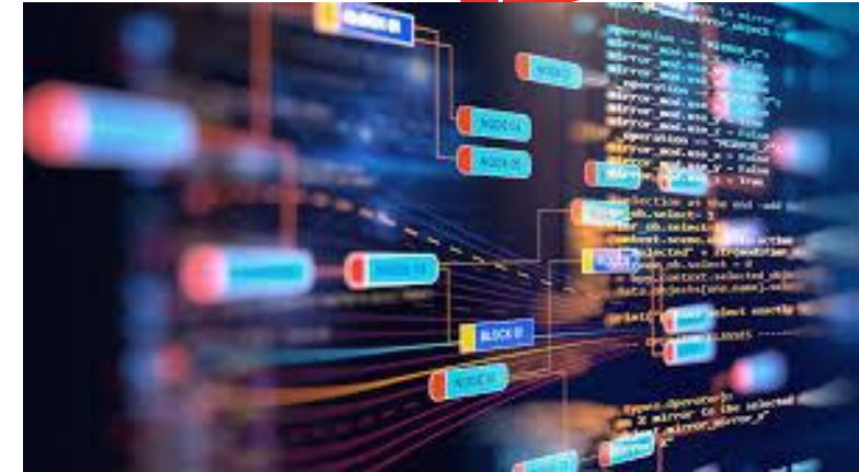
Com muitos dados para avaliar