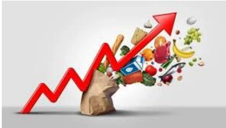
Aumento generalizado dos custos de produção